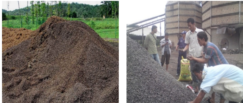
Gambar 1 Limbah cangkang kelapa sawit

Mannan, M. A., Ganapathy, C., 2001 dan Teo, et. al., 2002, memperlihatkan bahwa cangkang kelapa sawit mempunyai suatu potensi yang baik untuk digunakan pada beton ringan. Cangkang kelapa sawit juga sudah terbukti dapat digunakan sebagai agregat kasar pada beton ringan struktural.