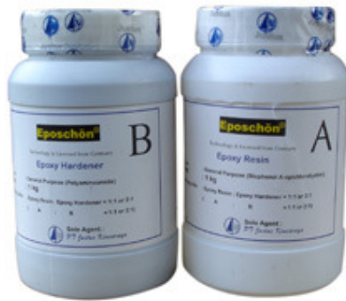
Gambar 1 Kemasan resin epoksi Eposchon®